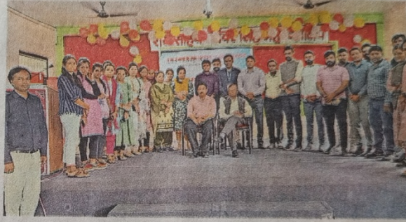
राय साहब भंवर सिंह कॉलेज में छात्र-छात्राएं व स्टॉफ।