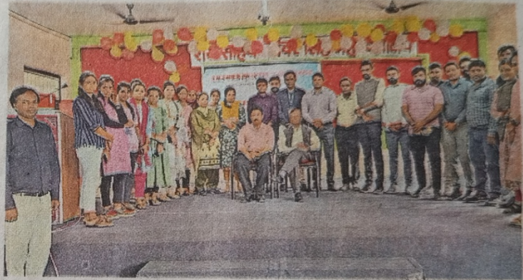
राय साहब भंवर सिंह कॉलेज में छात्र-छात्राएं व स्टॉफ।